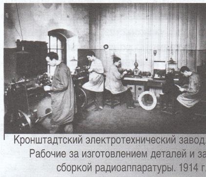
Кронштадтский электротехнический завод. Рабочие за изготовлением деталей и за сборкой радиоаппаратуры. 1914 г.

Беспокоясь о защите столицы, на её подступах возводились укрепления. Прежде всего, командование рассматривало возможность атаки Петрограда с моря, поэтому в помощь флоту на берегах Финского залива был возведён целый комплекс артиллерийских укреплений. На южном берегу — форты «Красная Горка» и «Серая Лошадь», на правом — форт «Ино».