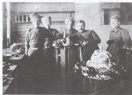
Моторная мастерская Гатчины. 1915 (из статьи про Гатчинскую авиационную школу)

цы проявили высокий уровень профессионализма. Население тыла вплоть до 1917 г. не испытывало серьёзных трудностей, даже если сравнивать с положением населения в Германии.