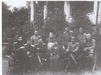
Группа офицеров Гатчинской военной лётной школы в 1915 году

Указатель освещает самые разные аспекты влияния Первой мировой вой-