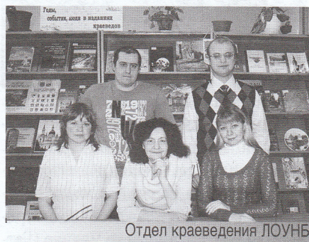
Отдел краеведения ЛОУНБ

Огромную роль в организации медицинской помощи раненым сыграли земства. Информацию об этом можно в избытке найти на страницах земских изданий. Вообще, земства сыграли огром-